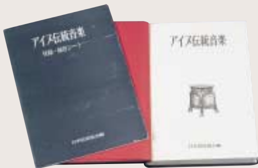
写真3 日本放送協会（編）『アイヌ伝統音楽』 上記のNHK札幌放送局による調査をもとに刊行されたものです。ソノシートが付いています。

戦後には、伝統的な芸能の記録を目的とした組織的な調査も行なわれるようになりました。例えば、日本放送協会（NHK）の事業の中でも札幌放送局による1961～63（昭和36～38）年の調査では、北海道の各地で300名以上の伝承者から採録しています。