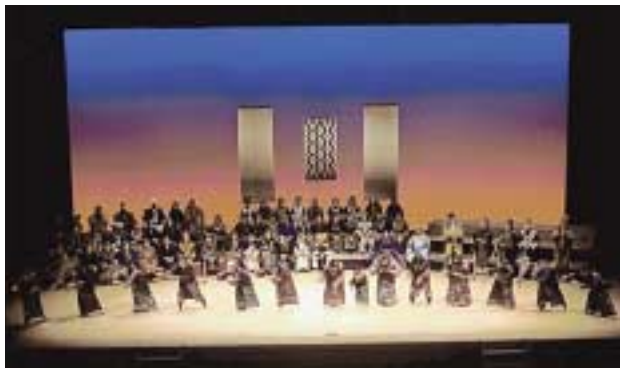
写真 1 帯広カムイトゥウボボ保存会の公演 (1997年、春採アイヌ古式舞踊釧路リムセ保存会 30 周年記念公演)

近年、アイヌの伝統文化の復興・継承の気運の中で、アイヌの芸能についても関心が高まり、学習・伝承へ向けた動きもおこってきました。道内のいくつかの地域では、舞踊の保存会などが組織され、それぞれの地域で伝承されてきた歌や踊りを学んだり、新たに他の地域のものを採り入れたりする活動が行なわれてきました。