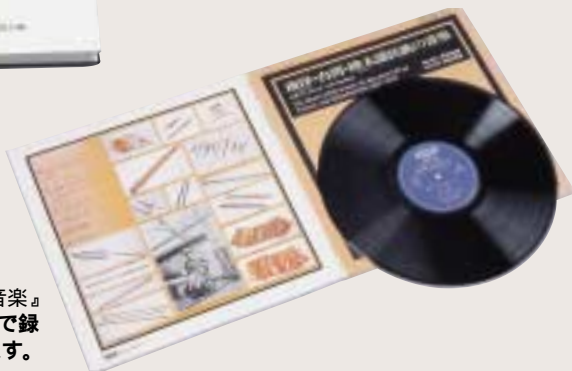
写真4 田辺秀雄監修 『南洋・台湾・樺太諸民族の音楽』 田辺尚雄が1923年にサハリンで録音した音楽も収められています。