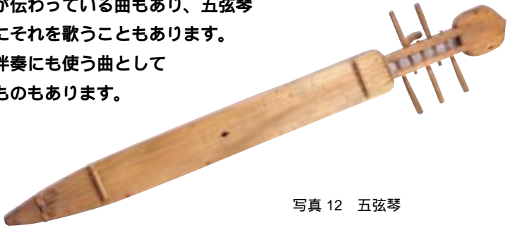
写真 12 五弦琴