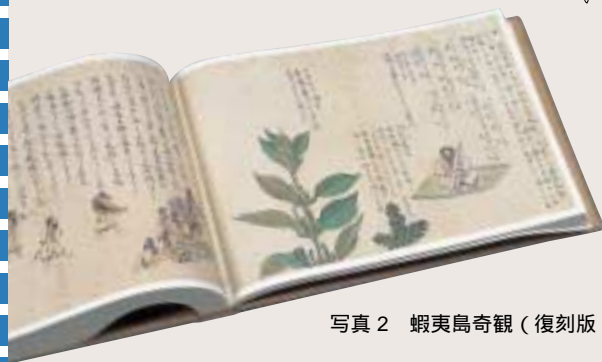
写真2 蝦夷島奇観(復刻版)