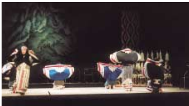
写真7 鶴の舞い(アイヌ民族博物館の公演、1998年、国立劇場)

アイヌの伝統的な歌では、音の高い低いだけでなく、声の出し方にもなる音色 ねいろ を組み合わせたことも、大事な要素となっているようです。