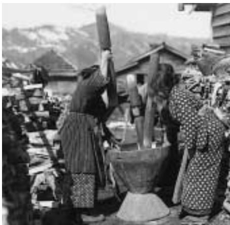
写真 6 杵搗きのようす

穀物などを搗くときに、その動作にあわせて歌います。近年ではこれをひとつの芸能の演目として行なうようにもなりました。作業のための簡単な掛け声のようなものから、ある程度まとまった歌詞を持つものまでいろいろあります。