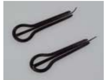
写真 10 金属製の口琴

竹製の口琴は道内でも比較的多くの地域に伝わっていますが、昔はそのような楽器はなかったというところもあります。