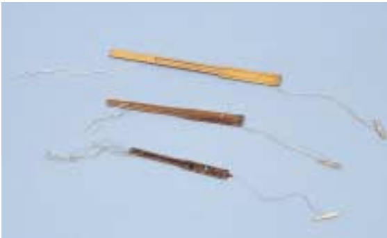
写真 9 竹製の口琴