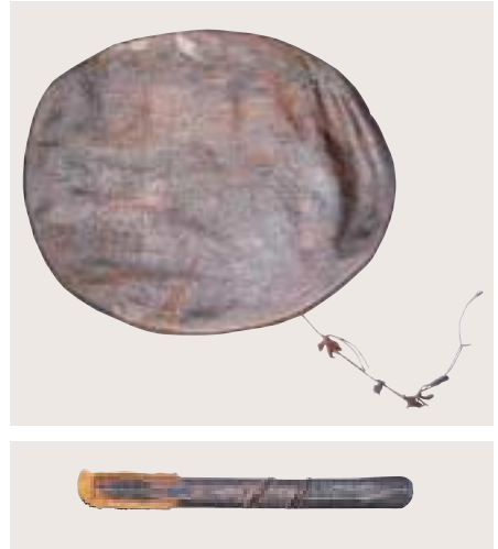
写真 13 太鼓とバチ

このほか昔の文献には、笛のような楽器として、ヨブスマソウの茎を利用したものや、木の皮をねじり巻いて管としたものなどがあることが知られています。