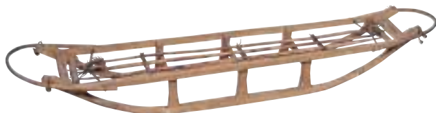
写真 37 そり(模型) サハリンでは冬に犬ぞりが 用いられました。