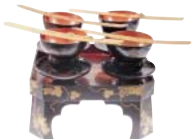
写真 20 儀式用の椀と台 儀式に用いる椀なども多くは漆塗りのもので、ふだんの食事用の椀とは区別して用いられました。