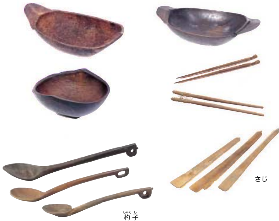
写真25 食事のときの器など