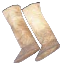
写真 39 トド皮製の 長靴(千島)