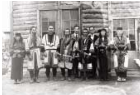
写真 12 1935(昭和10)年にアイヌ語研究者の金田一京助氏と久保寺逸彦氏がサハリンでアイヌ語やアイヌ文化の調査をしたときに撮影したものです。左端の女性が写真11のような帯をつけています。