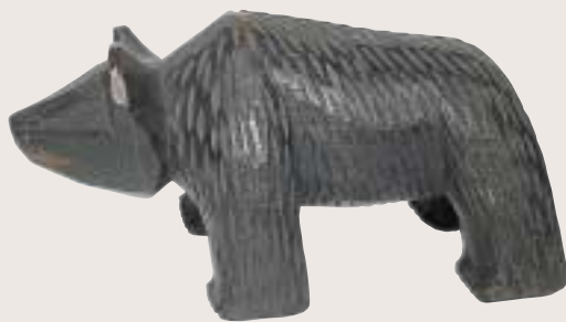
写真4 木彫りのクマ 1920年代ごろに旭川で彫られたものです。

現在よく見られるような木彫りのクマは、1920年代ごろに八雲町 やくも で作られるようになり、ほぼ同じころから旭川のアイヌの人たちが副業や工芸作品として自分たちの木彫りの技術を活かして作ったものが、各地に広まったと考えられています。