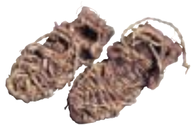
写真 38 ブドウツル製の履き物 (旭川)

履き物としては、サケやシカなどの皮で作ったもの、ブドウツルなどを編んで作ったものなどが知られています。