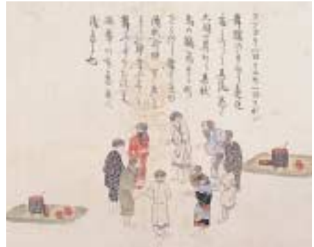
図1 『蝦夷島奇観』 200年ほど前に書かれたもので、輪になって歌いながら踊るようすを描いた部分です。わざといろいろな衣服をとりまぜて描かれています。

アイヌの伝統的な衣服は、獣・魚・鳥の皮、樹木や草の内皮からとった繊維、木綿を素材とするものが知られています。