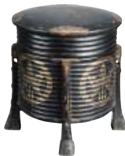
写真 19 漆塗りの容器 儀式に用いる酒を造ったり、造った酒などを入れておく容器として用いられました。