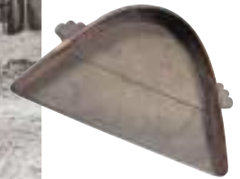
写真 28 箕