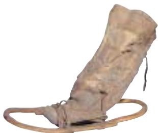
写真 40 獣皮の靴とかんじき(サハリン) 動物の皮で作った靴に木製のかんじきを付けた 状態です。このような履き物は、冬に狩猟をす るときなどに用いたとされています。