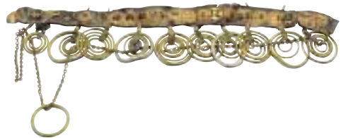
写真 11 女性の帯（サハリン） 帯の部分は皮製で、飾りの金具は皮紐で下げられています。サハリンでは儀式のときなどに女性がこのような帯を身につけたとされています。