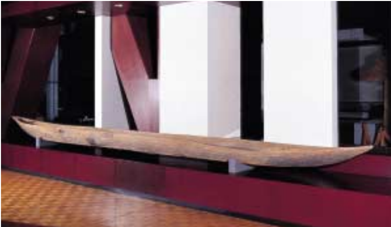
写真 33 丸木舟（北海道開拓記念館） 丸木をくり抜いて作られた舟です。川や海を行き来するときの交通手段として、また漁に出るときにも用いられました。カツラ、ヤチダモ、ハリギリ（センノキ）などいろいろな木で作られたようです。写真の舟はカツラの木で作られています。