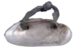
写真 29 穀物の取り入れのときには、鎌などを用いるほか、穂を摘み取るためにこのような道具も用いられました。(写真は日高の沙流地方のもので)