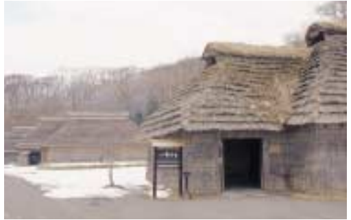
写真 17 復元されたカヤ葺きの家屋 (アイヌ民族博物館)

部屋にはカムイ*が出入りするとされる窓が設けられていました。その窓と炉のあいだの空間は、いっばんに かみざ 上座として尊ばれました。家の宝物を置く場所もおおよそ決まっていました。