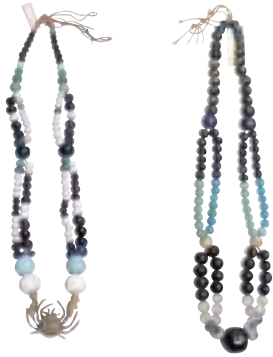
写真 10 首飾り (左：門別町、右：新冠町) 儀式のときなどに女性は首飾りを身につけます。