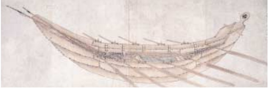
図5 『蝦夷生計図説』 沖まで航海できるよう、丸木舟に板を縄で綴 つづ って継ぎ足して大きくした舟の図です。舟の中には、漁で使う網や銚 もり が置かれています。櫓をこぐほかに、帆を張って進むこともできます。