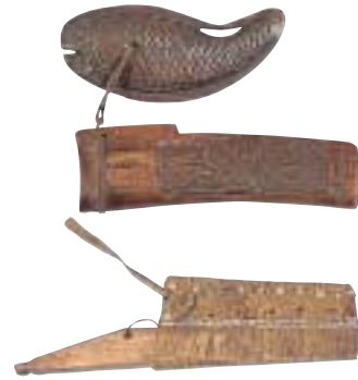
写真 15 小刀

上は鞘のみです。 ねつけ 根付（帯に下げておくときに、落ちないように紐の端に付けておく留め具）が付いています。下はサハリンのものです。