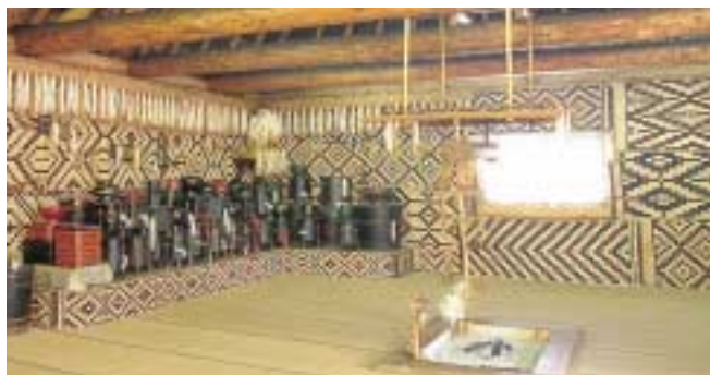
写真 22 模様をついたござを壁に張ったようす アイヌ民族博物館で復元されている家屋のようすです。 模様をついたござは、儀式のときに敷くか、またはこの写真のように壁に張ったりして用いられるものです。

ござは、ガマやスゲなどを編んでつくります。ござを編むときは、写真23のような機具を使いました。