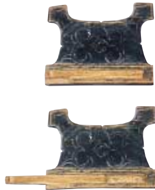
写真 14 糸巻き（静内）

針入れにはいろいろな材質や形のものが見られます。これは、鳥の骨で作っており、中の布に針を刺しておくつくりになっています。