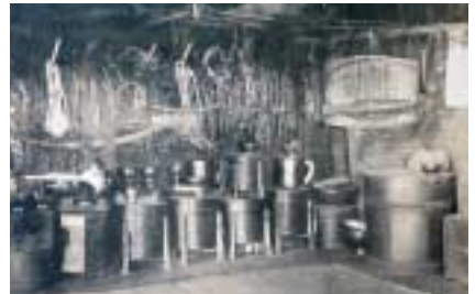
写真 18 上座に置かれた宝物など (帯広市、大正の終わりごろ)

博物館などの施設でアイヌの家屋やその一部を展示しているところがあります。これらは、おおよそ20世紀の初めごろまでに建てられた伝統的な家屋を復元しようとしたものです。