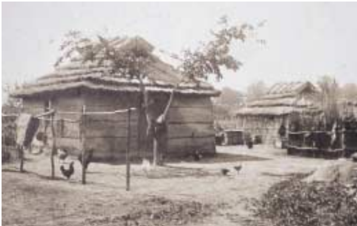
写真 26 家のまわりのようす（帯広市） 大正の終わりごろの写真です。

主屋のまわりには、祭壇 さいだん やクマなどの檻 おり 、倉などのほか、魚や肉を干すための柵 さお や竿などを設けることもあります。