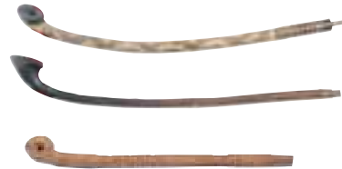
写真 16 タバコ入れ(左)と煙管(右)

上は鞘のみです。 ねつけ 根付（帯に下げておくときに、落ちないように紐の端に付けておく留め具）が付いています。下はサハリンのものです。