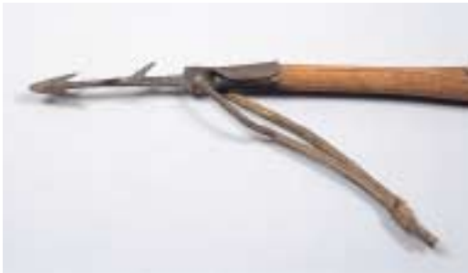
写真34 銚 もり （先端の部分）