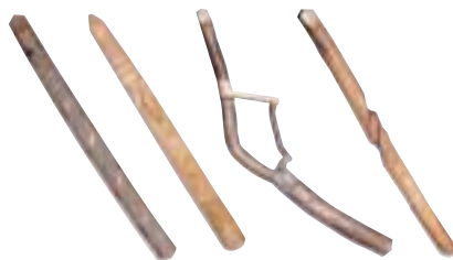
写真 21 酒を捧げるためのへら カムイや先祖に祈るとき、酒を捧げるために作られたものです。木や木の根などを削ったもので、彫刻が施されています。