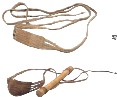
写真 36 背負い紐 ひも （上：石狩、下：千歳）

荷物などを背負うときに用いる紐です。両端の部分で荷物をしばり、中央部の幅広がっている部分を額にあてます。赤ん坊を背負うときにもこのような紐を用いることがあります。写真の下側の、棒が付いているものがそれで、棒の部分に赤ん坊を乗せて背負います。