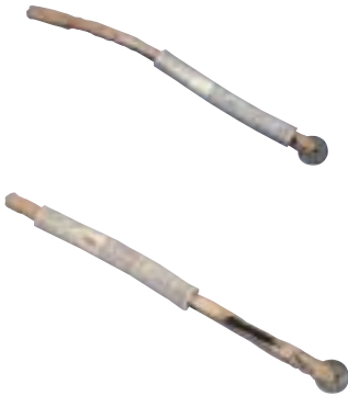
写真 13 針入れ

針入れにはいろいろな材質や形のものが見られます。これは、鳥の骨で作っており、中の布に針を刺しておくつくりになっています。