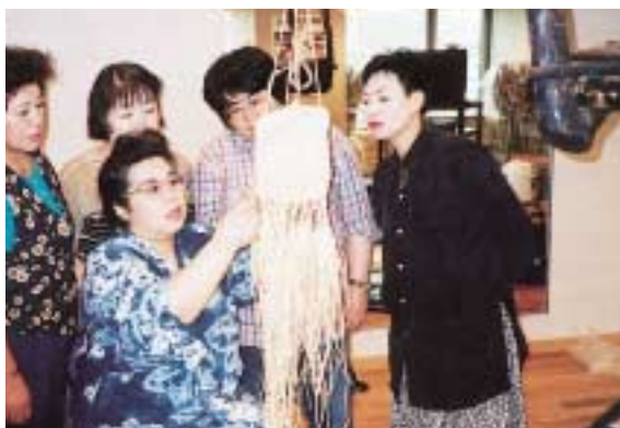
写真 1 北海道立アイヌ総合センターにおける編み袋の講習会

この小冊子では、おおよそ江戸時代の終わりごろから明治時代の初めごろにかけて用いられていたとされる民具を中心に紹介します。