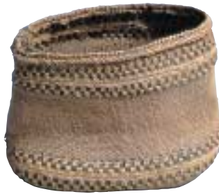
写真5 ハマニンニク（テンキグサ）で編んだ容器 主に千島で見られたものです。

昔の暮らしの中では、彫り物や縫い物などがきちんとできるようになることが、しっかりした大人になるために大切なこととされ、民具を上手に作ることでできる人は尊敬されたと言われています。