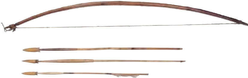
写真 30 弓と矢

写真の弓はイチイ(オンコ)で作られています。ふつう、矢の先にはトリカブトの根などからとった毒を塗ります。