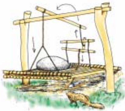
図 4 小動物用の わな 罾の例 テンなどの小型の動物をとらえるための罾の一例です。下に置かれているエサをとろうとすると紐が引かれて石を載せた重しが落ちてくる仕掛けになっているものです。