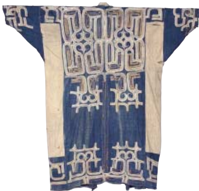
写真 6 木綿を素材にした衣服 千島で収集されたものです。文様の部分の 布は絹を使っています。

博物館などで展示されている、様々な文様が施された衣服の多くは、儀式のときなどに着る晴れ着として用いられたものです。労働などふだんの暮らしで着た衣服には、文様はあまり見られません。