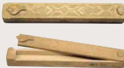
写真3 はし 箸入れ