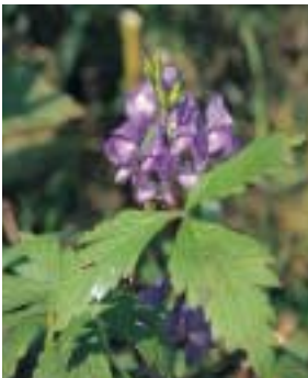
写真 31 トリカブト

写真の弓はイチイ(オンコ)で作られています。ふつう、矢の先にはトリカブトの根などからとった毒を塗ります。