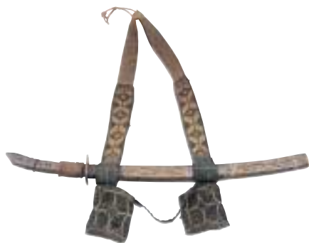
写真9 刀を吊るす帯と刀(日高の さる 沙流地方) この刀に限らず、刀身は実際にものを切るような とうしん つくりにはなっていません。また、鞘などに見られる飾りは表側だけで、裏側には見られません。

写真7で立っている男性と中央の男性は、肩からかけた帯に刀を吊り下げています。このような刀は、武器としてではなく儀式のとき身につけるものとされています。刀を吊るす帯は、樹皮を素材とした繊維などを使って編まれており、さまざまに文様などを編みこんだものが見られます。